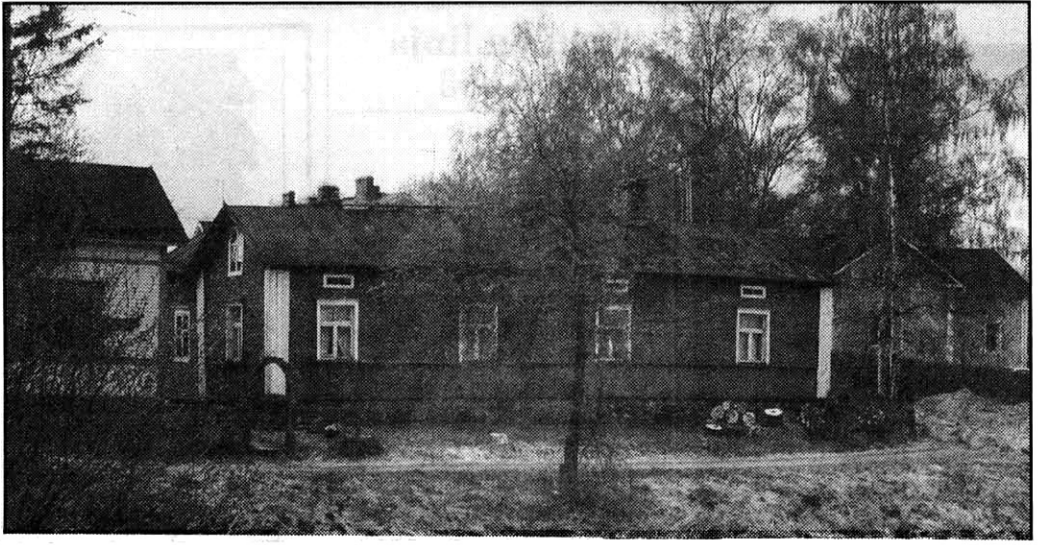
Lähes viimeinen valokuva yli 200-vuotiaasta tarinatalosta.