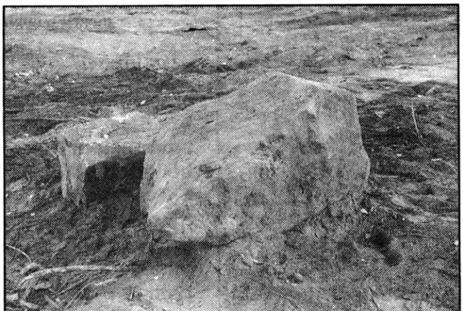
Etualalla olevan hieman kolmiomaisen kiven pituudeksi mittasin n. 90 cm, leveydeksi n. 20–40 cm ja korkeudeksi 90 cm.

Tämä kortteli on muutenkin historiallinen. Onhan siihen siirretty sekä Matila, Oulun vanhin puutalo, että "Kolmen fröökynän talo" ja nyt kohoaa naapuritontille Polttimokadulle Heikinkadun mäen päältä pelastettu "Pukusiskojen" puutalo.