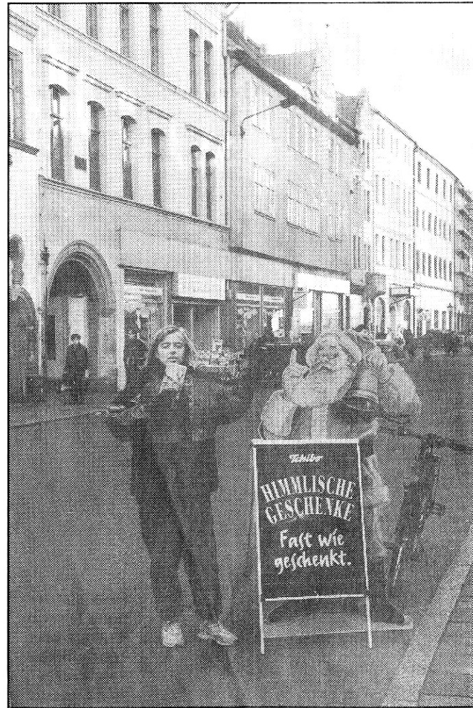
Lutherstadt Wittenbergin joulupukki ja tonttu huolitsijani, sihteerini, kantajani ja vetäjäni, tuo vasemmanpuoleinen lapsenlapsi.

Pikkujouluja en harrasta, mutta toivotan nyt kuitenkin rauhallista ja mahdollisimman epäkaupallista joulunodotusaikaa itse kullekin Oulussa!