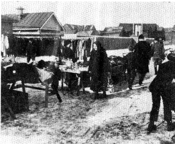
Oulun narikan tori Saaristonkadun puolella, mutta milloin...?

Vanhoille oululaisille Narikka, tai jos kirjoitamme pienellä kirjaimella niin kuin Pakkala, niin narikka oli nimenomaan (valmis)vaatekauppiainden myymälärakennus, oli jo sata vuotta sitten (ja rapia päälle) Aleksanterintorin reu-