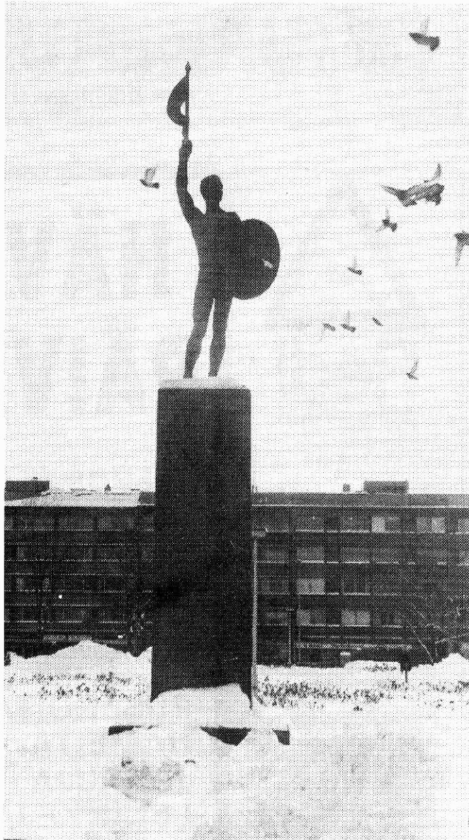
Eteläpohjalaisten muistomerkki Mannerheimin puistossa Oulussa.