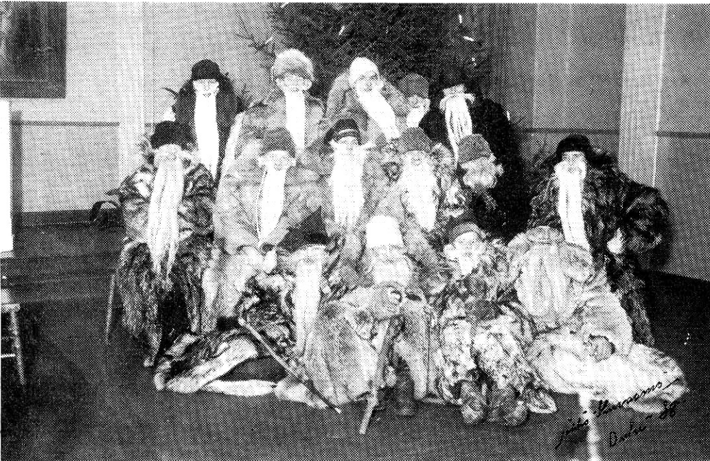
Ynnin ukit potretissa loppiaisien jälkeen 1938.