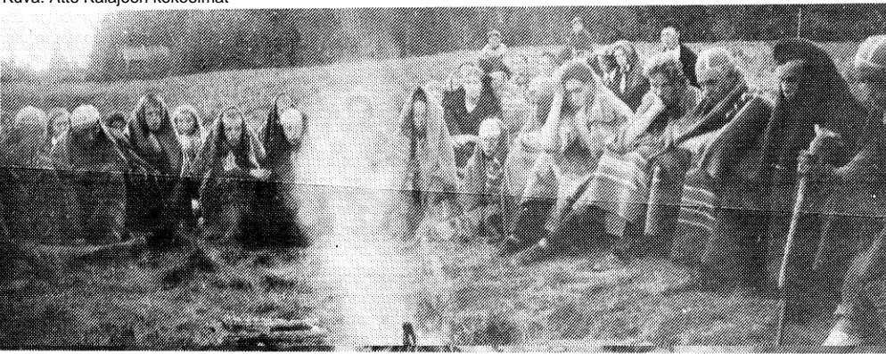
Kuka on säveltänyt Pohjan Veikkojen nuotiolaulun? Kuva partion nuotiolta vuodelta 1921.