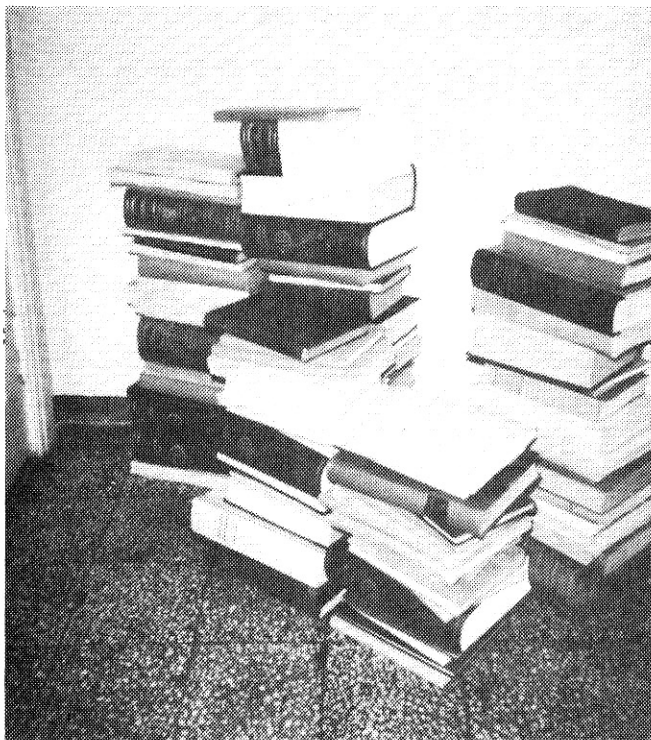
”Roskalaatikkokirjallisuutta” eli älkää heittäkö helmiä siioille.

Toivon, että tämä jää ymmärtäväisen lukijan mieleen opettavaisena tarinana, jota voi kertoa lapsille ja lastenlapsille.