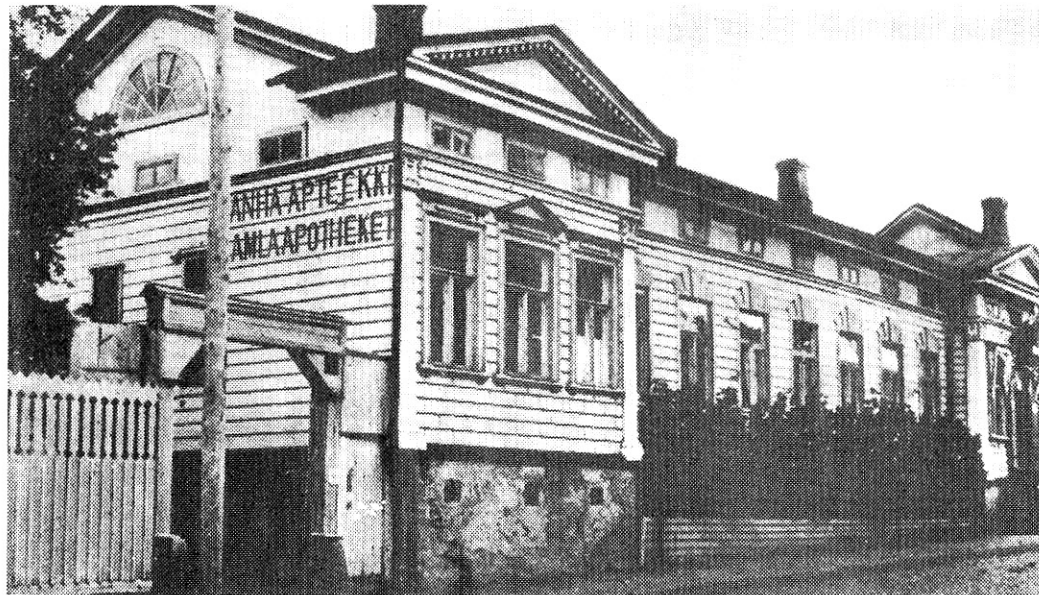
Oulun Vanhan apteekin puutalo F. Suomelan valokuvan mukaan. Kotka ja portaat apteekkiin oikealla.

Kunhan en muistaisi myös kaksoiskotkaa aptekin oven yläpuolella. Olin tosin vain kolmivuotias, kun se lensi pois, kuten myös naapurinkulmalta Uuden aptekin kotka, mutta lapsi saattaa muistaa sellaista, mikä on kiehtonut häntä. Kaksoiskotkathan poistettiin väkivalloin Vennään vallanku-