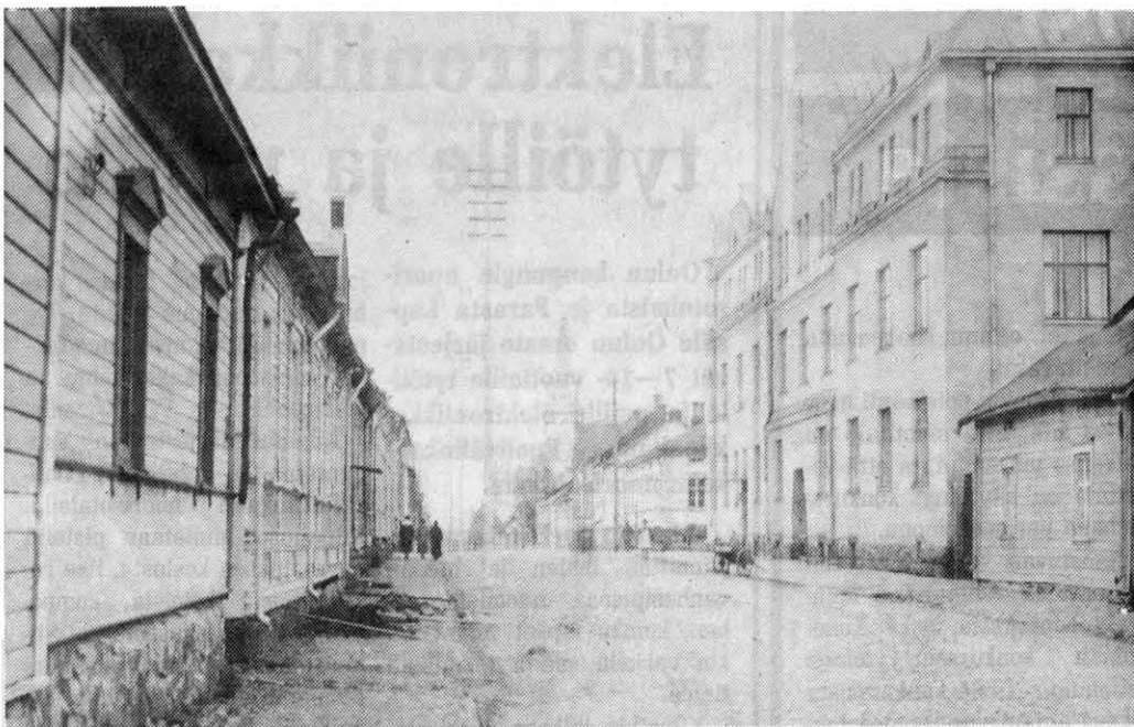
Kajaaninkatu vuosisadan alkupuolella.

Merkillistä muuten, että kun olin saanut kuvan toimituksen kautta postissa, minulle soitti lähettäjän hyvä tuttava samasta asiasta, mutta lähetyksestä tietämättä. Telepatiaa! Sitä tarvittaisiin myös nyt!