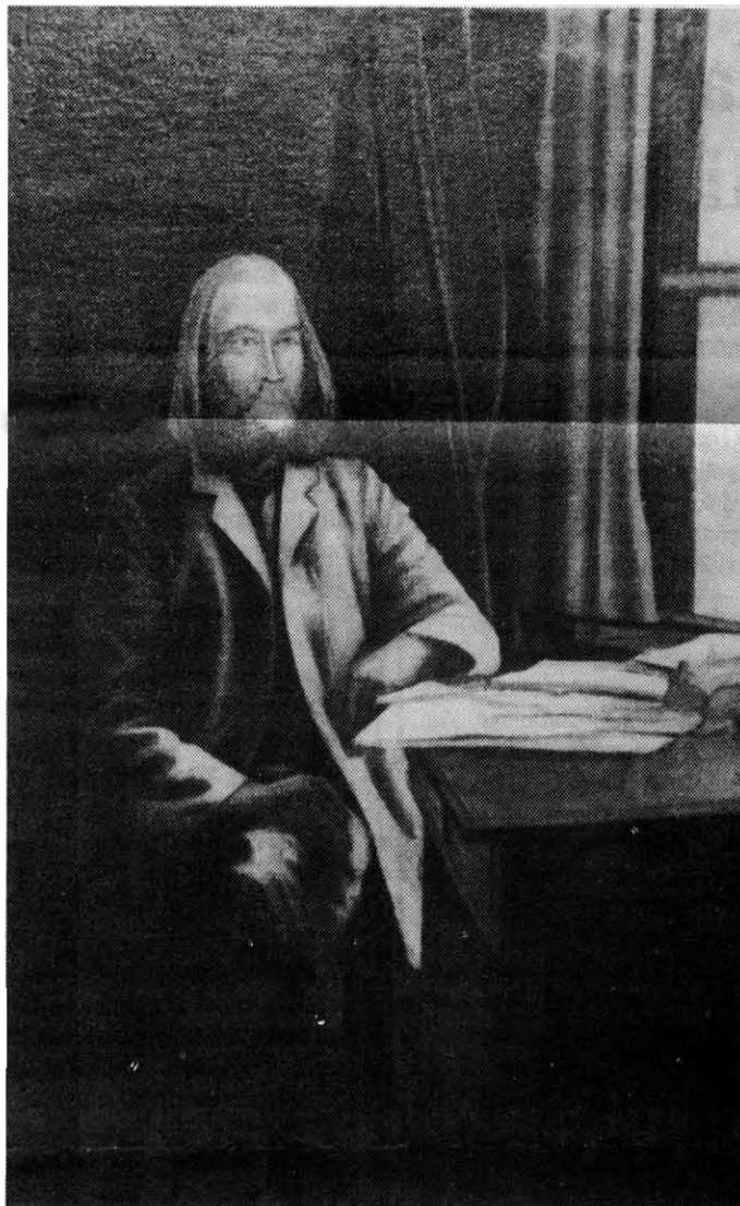
Ketä tämä maalaus esittää?