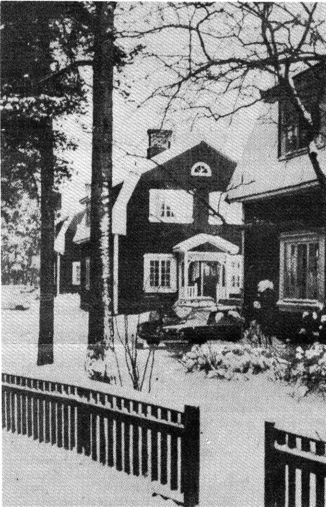
Koristeellinen rivi Porilan taloja alkuperäisessä asussaan.

Varjakan saha kävi... Vanhasta Varjakan rantatiestä poiketen oli rakennettu Varjakan satamaan eli möljälle uusi maantie niemen luoteispuolelle. Sen tien varrelle rakennettiin ensin 12 identtistä kahden perheen kaksikerroksista