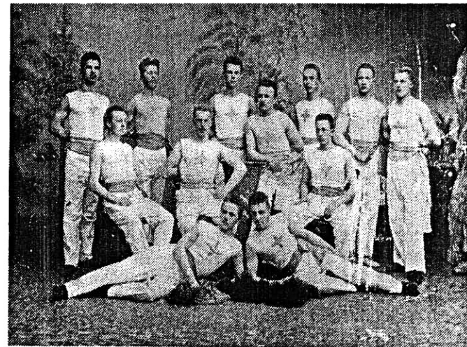
Suomen "ensimmäinen" IFK, oululaisten oma, ja sen reippaat pyramidinrakentajat vuosisadan vaihteesta.

USEMMILLE meistä lie-nee uutta, että Oulussakin on toiminut IFK, siis Idrottsförening Kamraterna-niminen urheiluseura, Oulun paikalla arvattavasti Uleåborg. Mitä mahtaa sitten tarkoittaa Erns Boströmin merkintä: "Huom Oulun "IFK" oli ensimmäinen Suomessa". Olisivatko tosiaan oululaiset ensimmäisinä käyttäneet tuota sitten niin monina aikoina suosittua seuranimeä! Olisivatkoahan tämän joukkueen pojat lisäksi olleet Oulun ensimmäiset pyramidinrakentajat? Viimeiset he eivät kylläkään olleet, sen monikin meistä muistaa, mutta miten mahtaa olla tänä päivänä!