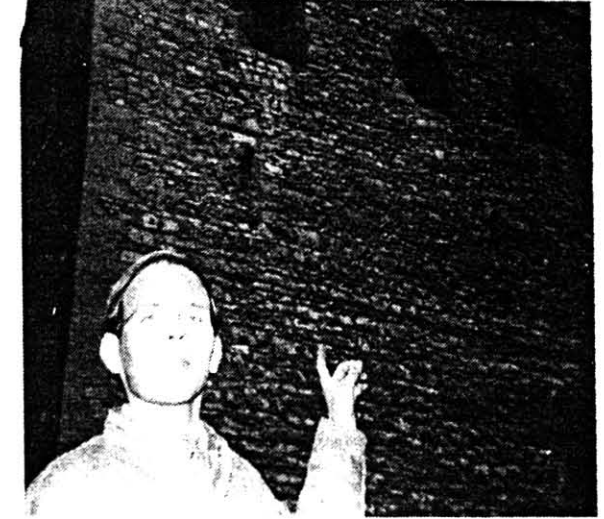
Göttingenin St. Johanniskirkko, jonka vasemmanpuoleisen tornin ylimpään ikkunaan, ylioppilasboksinsa ikkunaan, kuvattu opiskelija osoittaa.