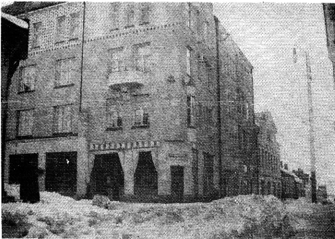
Kuvaharvinaisuus: Pallas Oulun keskustassa ennen itsenäisyyden aikaa.