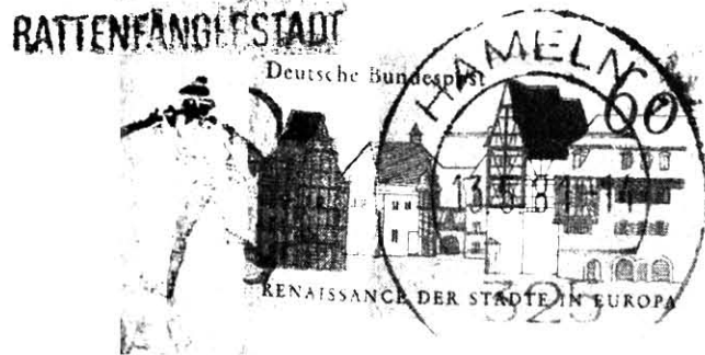
Hamelnin oma postileima vanhoja rakennuksia mainostavassa liittotasavallan postimerkissä.