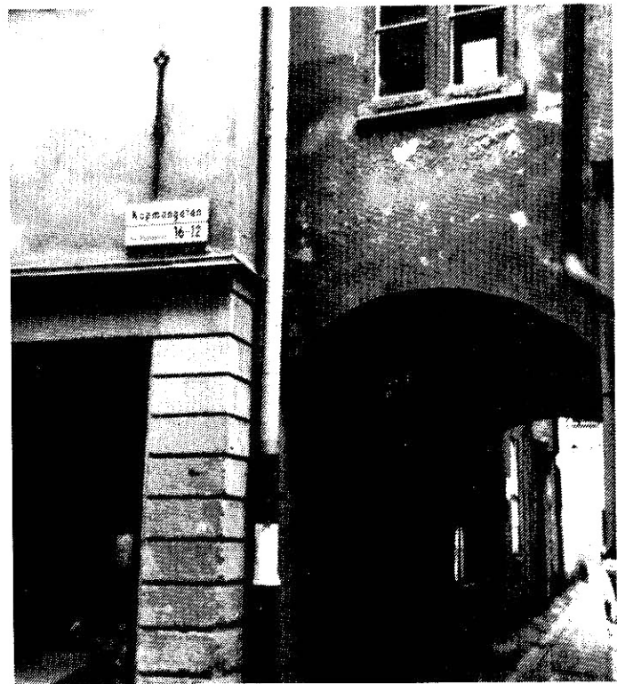
Köpmangatan 12 Tukholman Vanhassakaupungissa, pakinassa mainittu Sara Wacklinin talo. Porttiholvi vie Skeppar Olofs Grändiin eli laivuri Olavin kujalle, jonka seinässä vasemmalla Oulun kaupungin lahjoittama Sara Wacklinin muistolaatta.