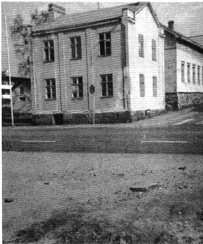
Puuseppä Svedbergin rakennuttama kivitalo ja entinen Wacklinin vanha puutalo Nummikadun-Aleksanterinkadun kulmassa -nyt jo kohta maan tasalla.

Rautatie oli vasta 13 vuotta erottanut kakaravaaralaiset sun muut entisistä laiturista, pottumaista, marjamaista ja leikkipaikoista. Laillinen kulku kävi kahden ylikäytävän kautta, laitonta ylitystä harrastettiin luultavasti yhtä paljon kuin nykyisinkin. Mahtaneeko sitten vähetä, kun avattiin oikea asematunneli!