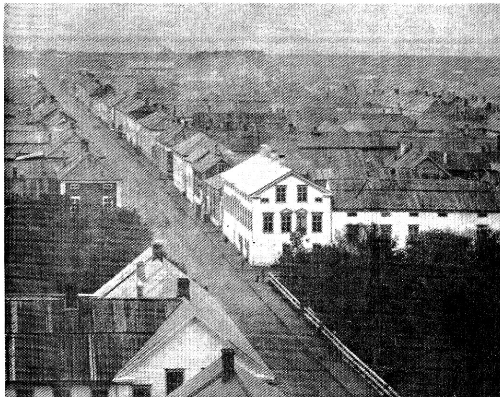
Valokuva Oulun Kirkkokadusta ja keskustasta sellaisena kuin se oli 1882-vuoden tulipalon raivotessa. Valkoinen kulmatalo keskellä Ahlstrandin talo (nyt SYP), seuraava Björkmanin talo, sitten Hellmanin, sitten Snellmanin Pakkahuoneenkadun kulmassa (nyt KOP), kaksi valkoista taloa, joiden välissä ilmeisesti portti. Tulipaloapteekki on niitä vastapäätä. Vasemmalta nyk. Snellmanin puisto. Pitkä rakennus taustalla Heinäpäässä, Kirkkokadusta oikealle keskellä, on kuuluisa Maneesi. Pohj.-Pohjanmaan Museon kuva.