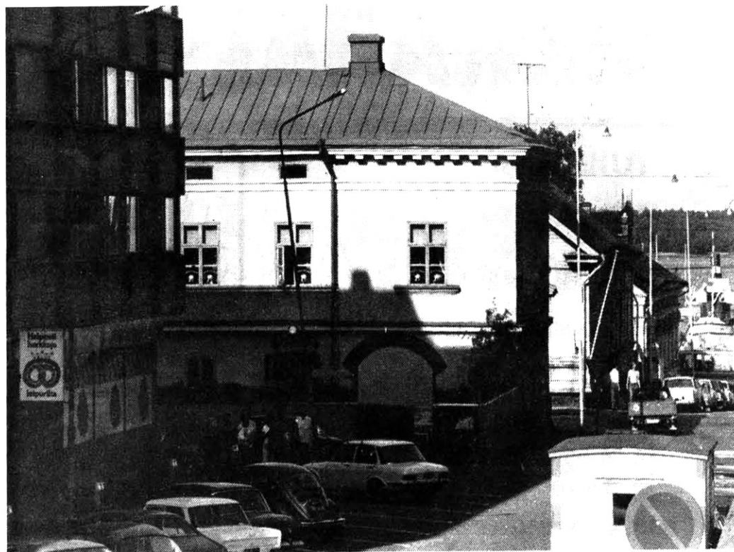
Oulu-lehden ikkunasta avautuu näkymä Kaarlenholvin taloon tällaisena. Jotkut pitävät tätä taloa Oulun vanhimpänä kivitalona.