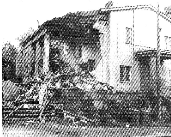
Kahden viraston pohtiessa mahdollisuutta keskeyttää Wäinö Aaltosen entisen ateljeerakennuksen purkamistyöt teki kaivinkone talosta tiilimurskaa. Sen jälkeen tuli määräys keskeyttää purkamistyöt!

Vaikka rakennukset kaatuvat, jää niissä tehty työ elämään. Silti olisi meidän jakettava valvoa myös sekä aineesta että hengestä pystytettyjen "rakennusten" kohtaloita!