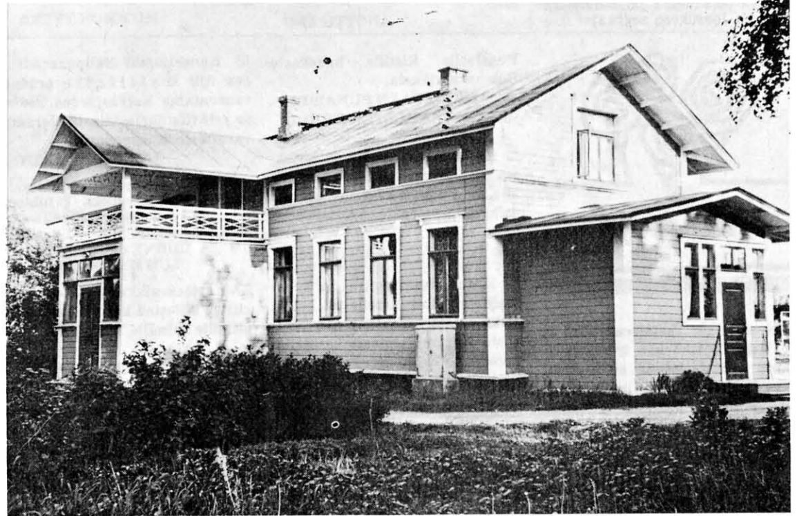
■ "Kraakkula" kesäkuuisena iltana 1972.