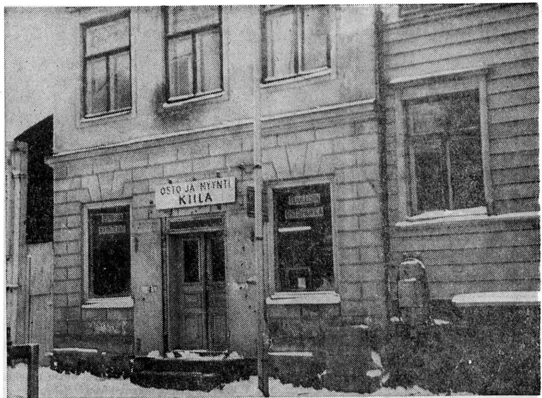
"RINGVALL OVEN PÄÄLLÄ", tästä se näkyy, uuden omistajan uuden Kauppurienkadun puoleisen kivitalon piirustukset 1864: "Facade..." Viereisen vanhan talon seinässä merk. "Gammalt hus",