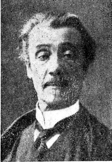
Kirjailija Teuvo Pakkala.

Minäkin innostuin silloin etsiytyäni Pakkalan jalanjälkiin. Selvisi yhtä ja toista mielenkiintoista. Kirjailija Pakkala oli sekä lapsena että aikuisena asunut vähän siellä ja täällä. Lapsijoukkoa aluksi ajoittain yksin elättänyt äiti Frosterus eli vähissä varoissa, niin että liikkuttava oli. Aikamiehenä Teuvo Pakkalan nimen ottanut Teodor Frosterus itsekin tuli ja meni etsien kirjailijana ja sanomalehtimiehenä paikkaansa yhteiskunnassa ja kai samalla rauhallista työpaikkaa ja -ympäristöä. Nuori paremmin kuin aikamies Pakkalanakaan ei ollut asunut missään kauan. Häneen liittyviä vanhoja oululaistaloja oli kuitenkin tallessa siellä ja täällä. Muistolaatata kiinnostuneiden sopi vain valita. Asia meni puheeksi myös silloin vastaperustetun Kotiseutuseura Oulun hallitukseen. Siellä valittiin kaksi ”pääehdokasta”. Torikadun numerona 64 säilynyt talo Heinätorin koulun länsipäätyä vastapäätä ja Sarkkisen talo Kakaravaaralla Kauppurienkadun ja Koulukadun kulmauksessa. Ensiksimainitussa talossa