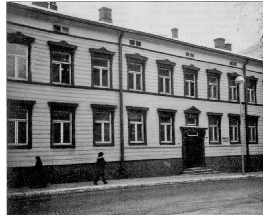
Toppeliuksen talo tänään kadun puolelta kuvattuna.