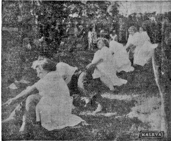
Oulun kalanmyyjät kiskovat voiton.

J.K. Jokohan kukaan nyt uskoi, että Varjakan möljää tarvitaan, että se on julkinen ja suurta yleisöä palveleva asia, joka on kunnostettava, ennenkuin niska katkeaa ja joku hukkuu. — Sama.